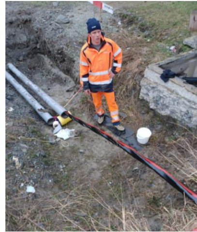
MS Kabelzug mit Kabelfett