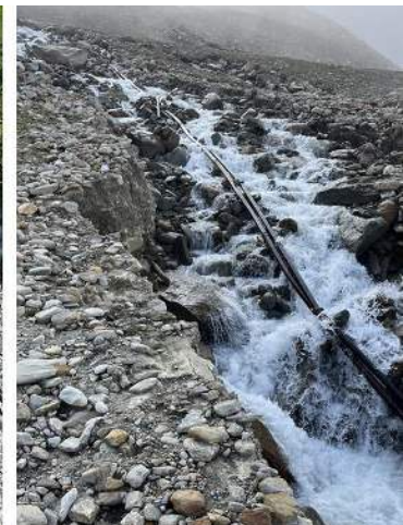
Unterspülung MS Kabel Saas-Grund/ Kreuzboden- Hohsaas