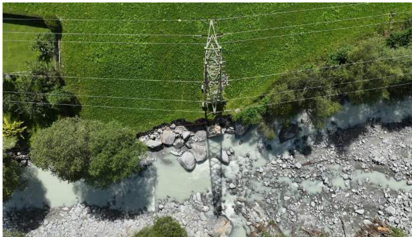
Unterspülung 65/16 kV Gittermast St. Niklaus Balmatten