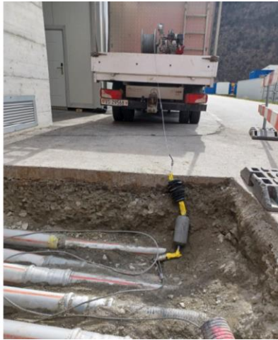
Verlegen von Einzugsseil