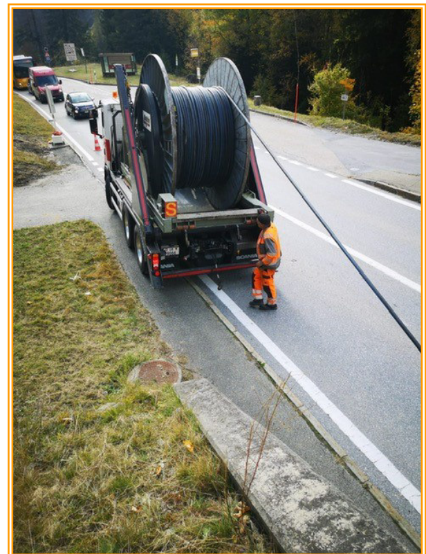
ASTRA, Ersatz NS Kabel