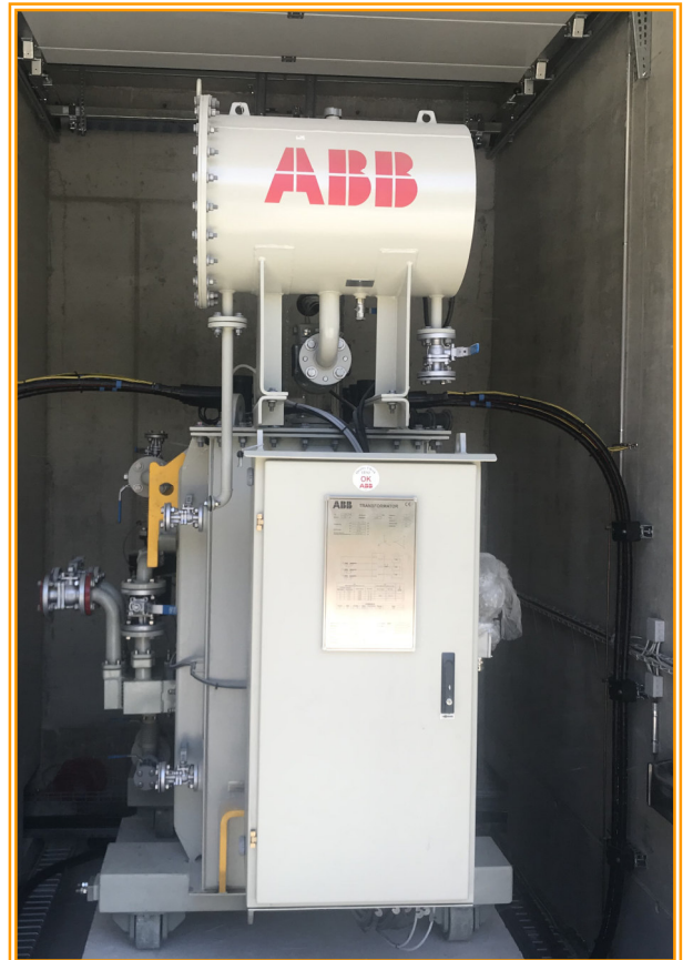
Anschluss Trafos Kraftwerk Gere