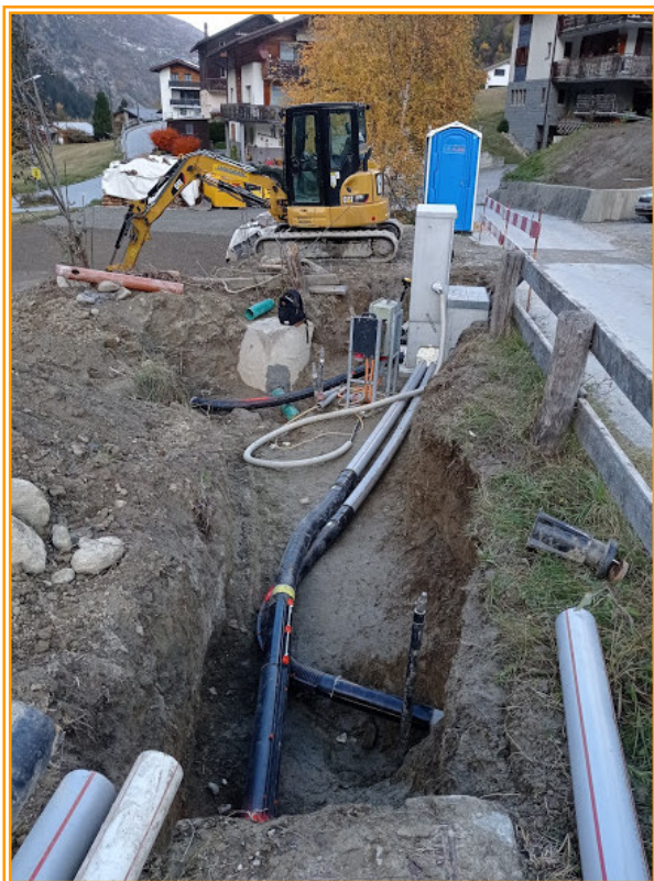
Neuer Verteilkasten Feld, St. Niklaus