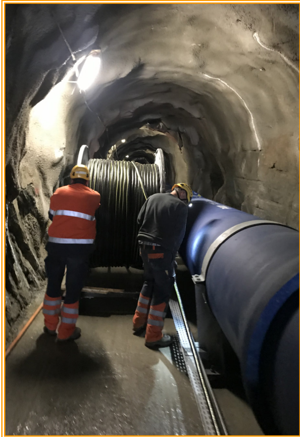
Kabelzug Kraftwerk Gere